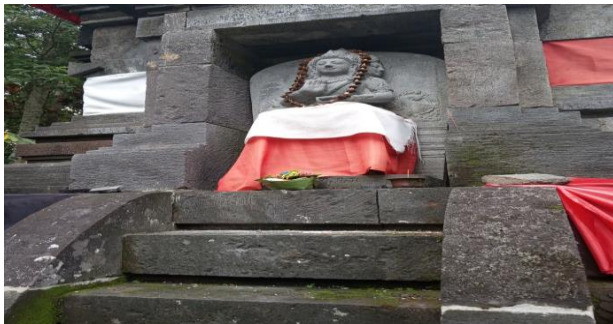
Gambar 4.5 Arca Siwa-Budha

2. Pada bilik relung bagian Barat terdapat Pengarcean Siwa-Budha/Tri Murti (Brahma, Wisnu, Siwa) yang bermakna utpeti, stiti, praline sebagai satu kesatuan sosok berukuran diwujudkan dengan sikap darma cakra prawartana mudra. Dalam hal ini makna dari pengarcean Siwa-Budha adalah sebagai symbol dalam menciptakan, memelihara, pelindung alam beserta isinya.