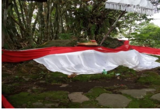
Gambar 4.2 Tempat Payogan Maha Rsi Markandeya

Oleh karena banyak penemuan-penemuan di berbagai tempat yang berbeda, dapat disimpulkan bahwa dulunya merupakan tempat pasraman yang luas. Lokasi persis payogan dari Maha Rsi Markandeya dari sinilah awal kehidupan agama Hindu dan adat yang ada di Bali muncul. Kehidupan umat Hindu di Bali tidaklah lepas dari maha rsi- maha rsi yang mendapatkan ilham dan berdharma yatra ke pulau Bali. Apalagi tonggak awal kehidupan spiritual agama Hindu di Bali adalah peranan Maha Rsi Markandeya yang menanamkan Panca Datu dan merintis berdirinya Pura Bekasih di Bali. Maha Rsi juga menyebarkan sistem irigasi (subak), sistem bercocok tanam, dan sistem desa pakraman. Jasa beliau juga terkait dengan penataan desa spiritual pada desa pakraman dengan menganjurkan masing-masing desa memiliki tempat suci. Pada lontar disebutkan bahwa beliau mendapatkan wahyu untuk menata kehidupan spiritual dan sosial di pulau yang menurut