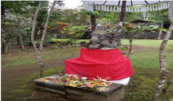
Gambar 4.8 Arca Dewa Ganesa

6. Selanjutnya pada bagian depan tepatnya di pintu masuk candi terdapat pengarcaan Dewa Ganesa yang bermakna sebagai Dewa pengetahuan dan kecerdasan, Dewa Pelindung, Dewa penolak balak dan Dewa Bijaksana.