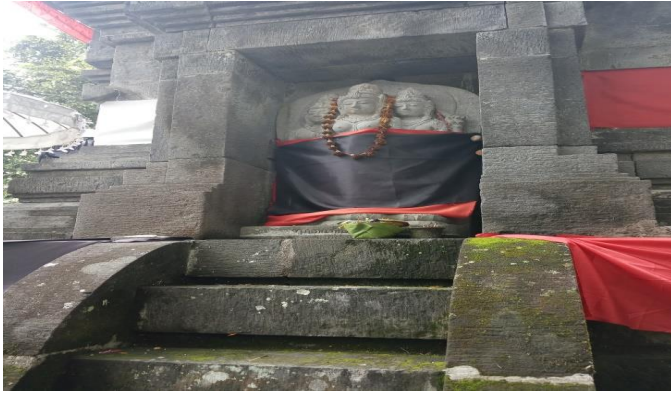
Gambar 4.6 Arca Dewi Saraswati, Dewi Laksmi dan Dewi Pawarti

5. Sedangkan pada luar bangun utama candi terdapat Candi perwara (Nandini). Candi yang berfungsi sebagai wahana atau kendaraan Dewa Siwa. Candi ini terletak di depan candi induk sejauh 17 meter kearah selatan dengan posisi saing berhadapan. Secara keseluruhan bentuk dasar candi bagian bawa (lingkaran) dan bagian atas (bujur sangkar) sama dengan candi induk, yang berbeda hanyalah dimensi dan isi bilik. Tinggi candi berdiameter dasar adalah 5 meter. Panjang Nandini 58 cm, duduk di atas bebatuan dengan dua roda pedati. Ada relief di bagian samping kiri-kanan dan belakang yang merupakan modifikasi dari Candi Tebing Tegallingsah Tampaksiring. Di bagian depan dilengkapi dengan Makara Singa, tanpa Bedawang Nala.