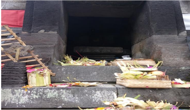
Gambar 4.4 relung bilik yang terdapat Lingga Yoni

2. Pada bilik relung bagian Barat terdapat Pengarcean Siwa-Budha/Tri Murti (Brahma, Wisnu, Siwa) yang bermakna utpeti, stiti, praline sebagai satu kesatuan sosok berukuran diwujudkan dengan sikap darma cakra prawartana mudra. Dalam hal ini makna dari pengarcean Siwa-Budha adalah sebagai symbol dalam menciptakan, memelihara, pelindung alam beserta isinya.