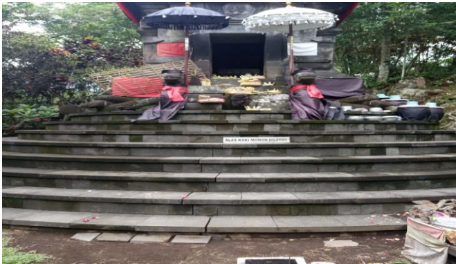
Gambar 4.3 Arca Naga Basuki dan Naga Ananta Boga

Pada Candi Agung Gumuk Kancil berisi Pengarcean terdiri dari bagian luar, dikelilingi tiga bilik relung candi. Pertemuan antara bagian dasar sebagai bagian badan diisi bedawang Nala, Naga Basuki (di kanan) dan Naga Ananta Boga (kiri). Masing-masing bilik relung candi berisi pengarcean memakai sandaran basement berfungsi sebagai titik pusat konsentrasi pemujaan. Pengarcean dan pemujaan melalui arca disebut murti puja.