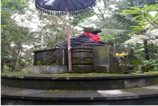
Gambar 4.7 Candi Perwara

6. Selanjutnya pada bagian depan tepatnya di pintu masuk candi terdapat pengarcaan Dewa Ganesa yang bermakna sebagai Dewa pengetahuan dan kecerdasan, Dewa Pelindung, Dewa penolak balak dan Dewa Bijaksana.